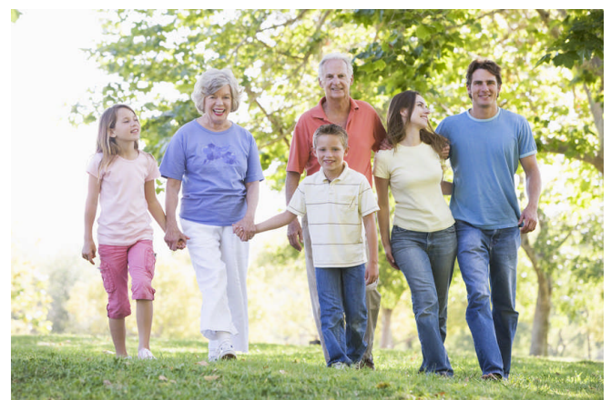
Bild: Das Titelbild der neuen Homepage der LVGF

Ergänzende Hinweise: Für Fehler redaktioneller und technischer Art sowie für die vollständige Richtigkeit der Eintragungen kann keine Haftung übernommen werden. Insbesondere kann keine Gewähr für die Vollständigkeit und Richtigkeit von Informationen übernommen werden, die über weiterführende Links erreicht werden. Falls von unserem Internetangebot auf Seiten verwiesen wird, deren Inhalt Anlass zur Beanstandung gibt, bitten wir jeden, uns dies umgehend mitzuteilen.