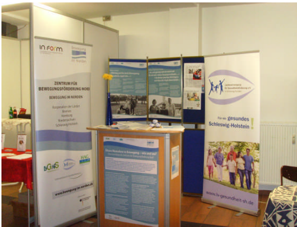
Foto 2: Messestand der LVGF auf den Seniorentagen Kiel

Vorge stellt wurde das Projekt „Bewegung im Norden - Zentrum für Bewegungsförderung Nord“. An beiden Tagen konnten viele Kontakte zu Multiplikatoren, Besuchern und anderen Ausstellern geknüpft werden. Ein vielfältiges Vortragsprogramm rundete die Messe ab.